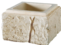
Boisseaux BRIDOIRE L. 167 x H. 20 cm