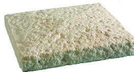
Chapeau de pilier BRIDOIRE L. 42 x l. 42 x h. 7 cm