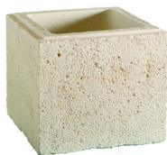
Boisseaux VALANCAY L. 35 x l. 35 x H. 30 cm