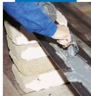
Application d'Adesilex PG1 sur plaque métallique