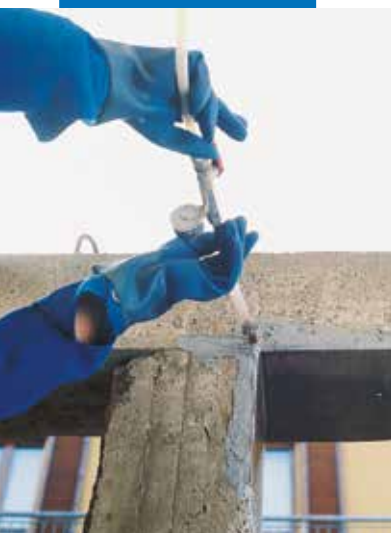
Poutres renforcées avec Adesilex PG1