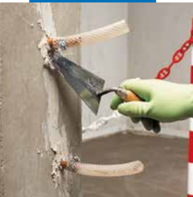
Fixation de tubes d'injection et traitement des fissures lors de la consolidation structurale