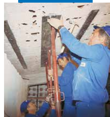
Renforcement de structures par plaquage métallique