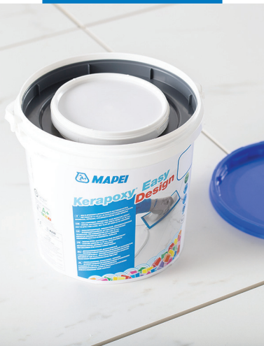
Mortier de jointoiment bicomposant fourni en bidons contenant les 2 composants A et B