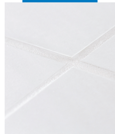
Sol jointoyé avec Kerapoxy Easy Design

Utilisé comme adhésif, la consommation de Kerapoxy Easy Design est de 2-4 kg/m 2 et peut varier selon la taille du carrelage. La consommation de MapeGlitter et