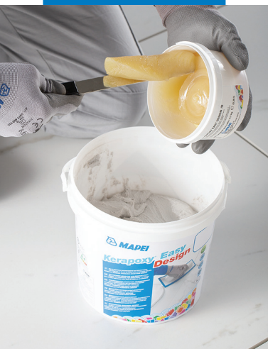
Verser le durcisseur (composant B) dans le bidon du composant A