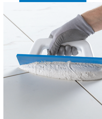
Application de Kerapoxy Easy Design avec la spatule Mapei