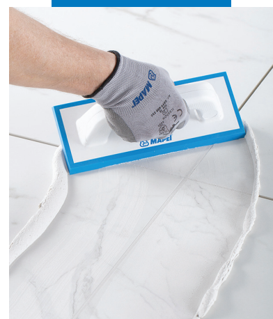
Mortier de jointoiment facile à appliquer