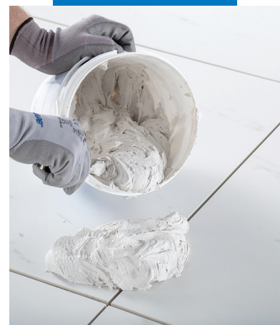
Obtention d'un mélange homogène de consistance crémeuse