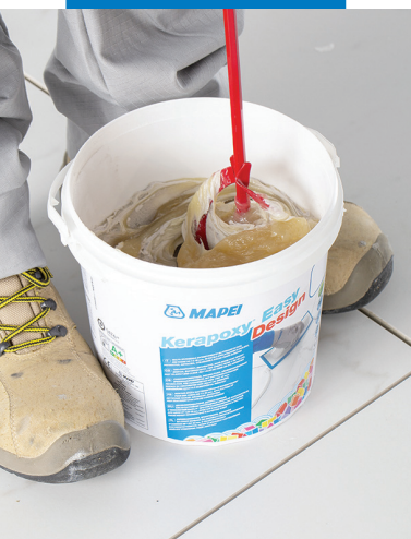
Mélanger les composants (A+B)

coloris de Kerapoxy Easy Design peut créer de nombreux autres effets esthétiques métalliques d'intensité et de nuance différentes. Il est conseillé d'effectuer des tests préliminaires car le résultat sera différent selon les couleurs et les quantités utilisées. Toutefois, respecter le dosage maximum de 3% en poids afin de ne pas affecter l'ouvrabilité du mortier.