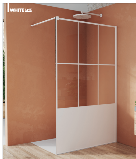
↑ Finition Blanc Mat