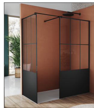
↑ WALK-IN EASY double paroi fixe avec profilé mural de compensation 2x STR4P + pièces de jonction VT90.10 pour barre de stabilisation (Noir mat)