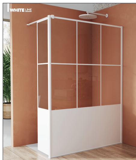
↑ Finition Blanc Mat