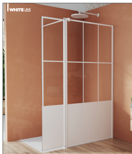
↑ Finition Blanc Mat