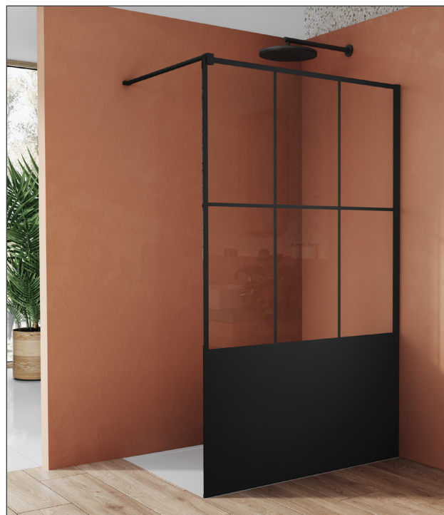
↑ WALK-IN EASY paroi fixe avec profilé mural de compensation STR4P (Noir mat), vitrage Loft 76