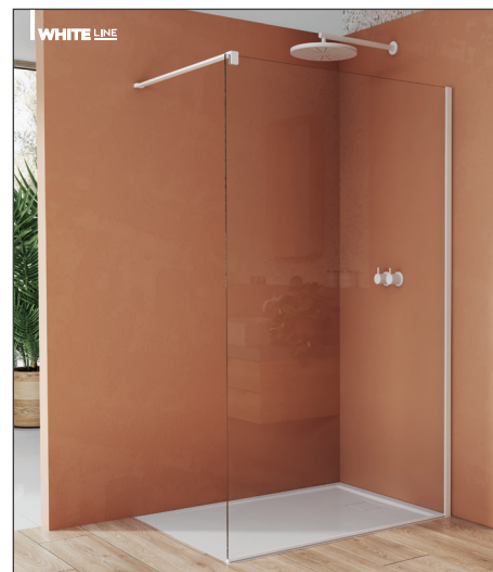
↑ Finition Blanc Mat