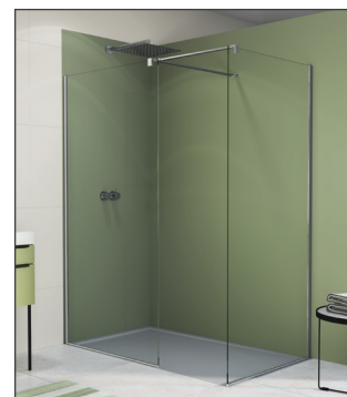
↑ WALK-IN EASY double paroi fixe avec profilé mural de compensation 2x STR4P + pièces de jonction VT90.10 pour barre de stabilisation (Poli-brillant)