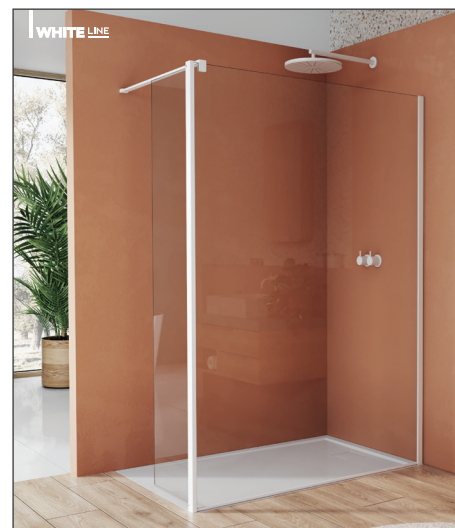
↑ Finition Blanc Mat