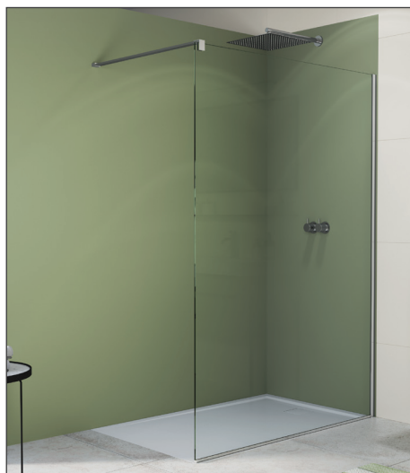
↑ Finition Poli-Brillant