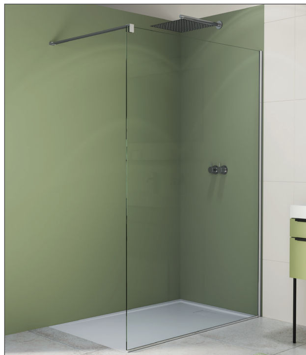
↑ WALK-IN EASY paroi fixe avec profilé mural de compensation STR4P (Poli-brillant), vitrage transparent