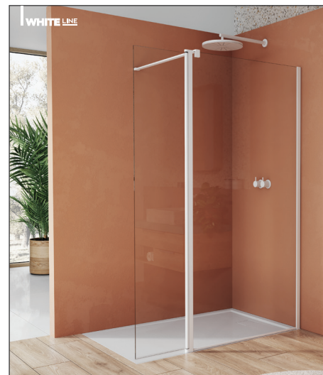
↑ Finition Blanc Mat