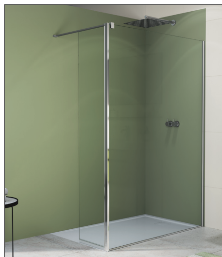
↑ Finition Poli-Brillant