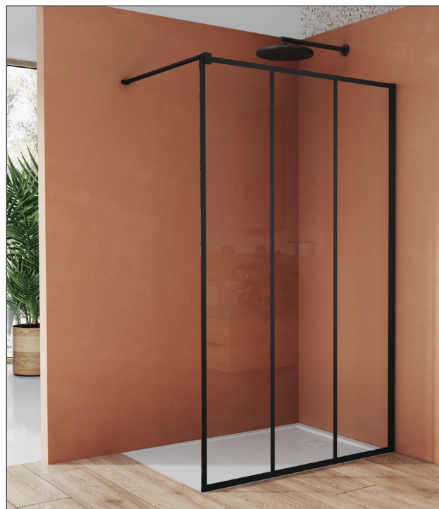
↑ WALK-IN EASY paroi fixe avec profilé mural de compensation STR4P (Noir mat), vitrage Loft 72