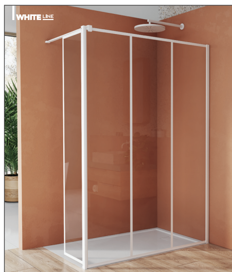
↑ Finition Blanc Mat