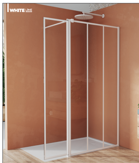
↑ Finition Blanc Mat