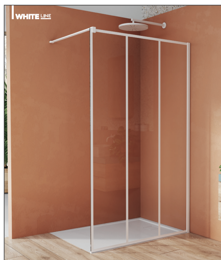
↑ Finition Blanc Mat