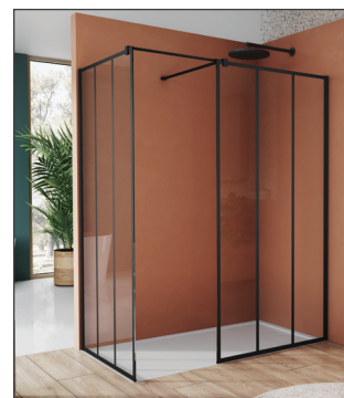
↑ WALK-IN EASY double paroi fixe avec profilé mural de compensation 2x STR4P + pièces de jonction VT90.10 pour barre de stabilisation (Noir mat)