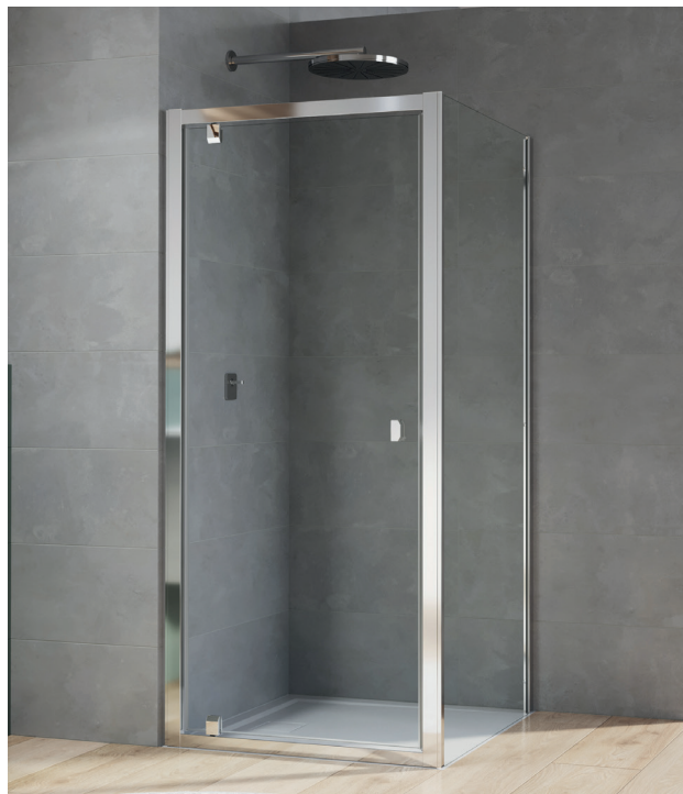
↑ ARELIA porte pivotante D20T1 + paroi fixe à 90° D20F1 (Finition Argent Poli)