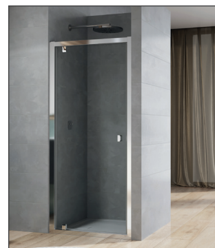
↑ ARELIA porte pivotante D20T1 (Finition Argent Poli)