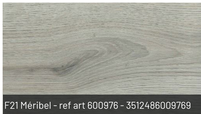
F21 Méribel - ref art 600976 - 3512486009769