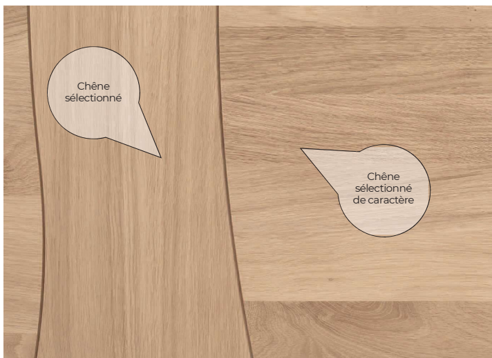
Du Chêne sélectionné de caractère (fil horizontal) pour le contraste de teinte et un bandeau courbé, tel un arbre, en Chêne sélectionné (fil vertical)