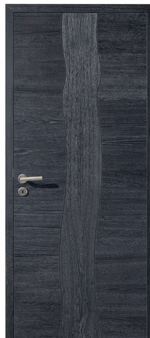
Chêne sélectionné de caractère ardoise brossé