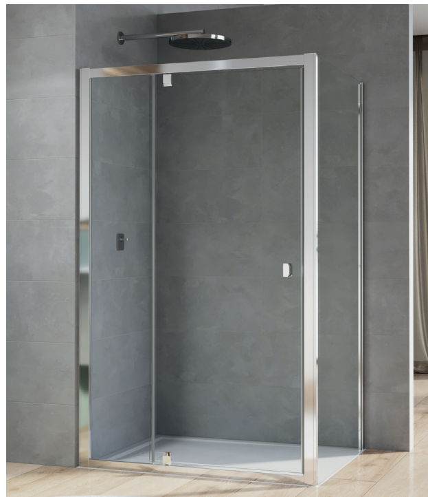
↑ ARELIA porte pivotante et fixe en ligne D20T13 + paroi fixe à 90° D20F1 (Finition Argent Poli)