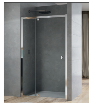
↑ ARELIA porte pivotante et fixe en ligne D20T13 (Finition Argent Poli)