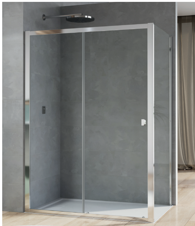
↑ ARELIA porte coulissante D20S2 + paroi fixe à 90° D20F1 (Finition Argent Poli)