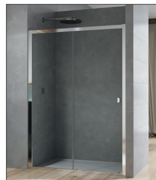
↑ ARELIA porte coulissante D20S2 (Finition Argent Poli)