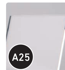
▲ Verre acrylique épaisseur 4 mm (950x 500 mm)