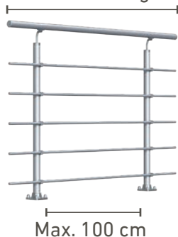
Exemple Fixation Sol 150 cm de longueur