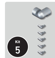
▲ Kit d'angle (x1)