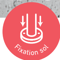
▲ NEW RONDO - Fixation sol