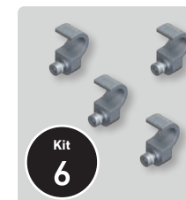
▲ Pack de 4 supports pour verre acrylique (x1)