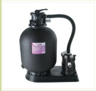
Système de filtration 8m 3 / h