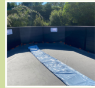
Feutre de fond

Le kit de chacune des piscines JUSTapposé comprend :