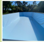
Liner 75/100 traité anti-UV