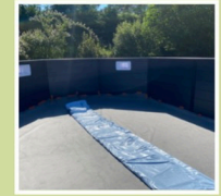
Feutre de fond

Le kit de chacune des piscines JUSTapposé comprend :