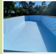
Liner 75/100 traité anti-UV