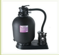
Système de filtration 8m 3 / h