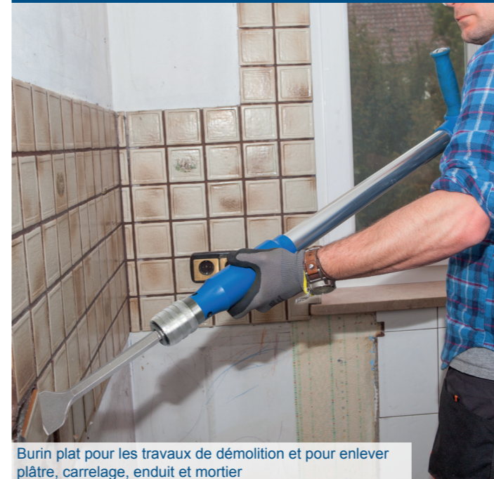
Burin plat pour les travaux de démolition et pour enlever plâtre, carrelage, enduit et mortier