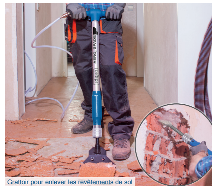
Grattoir pour enlever les revêtements de sol