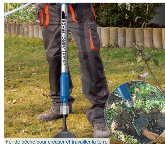
Fer de bêche pour creuser et travailler la terre