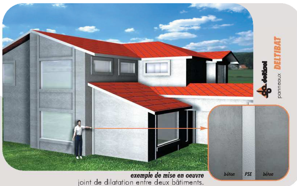
exemple de mise en oeuvre joint de dilatation entre deux bâtiments.

La mise en oeuvre du panneau DEL TIBAT répond simplement à l'application choisie. Il n'existe pas de normes ni de cahiers techniques à ce jour décrivant une procédure particulière d'utilisation.