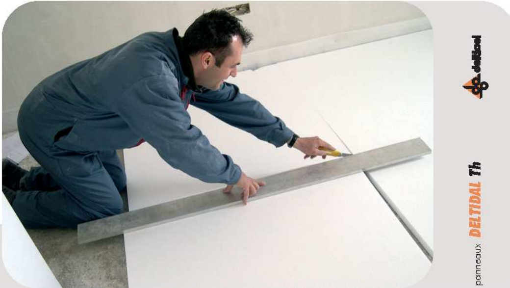
exemple de mise en oeuvre

La mise en œuvre du DELTIDAL Th se réalise selon les DTU 52-1 (revêtement de sol scellé) ou DTU 26-2 (revêtement de sol collé).