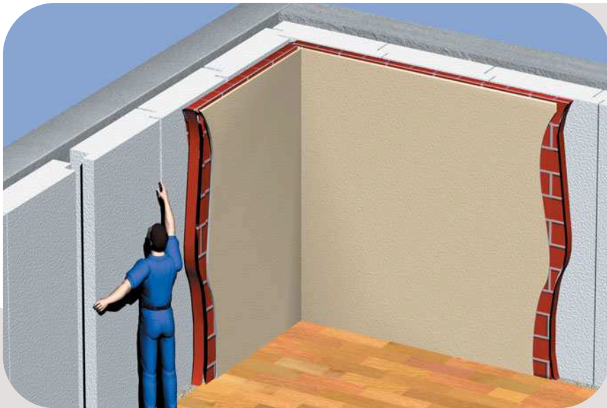
exemple de mise en oeuvre

Les panneaux DELTIMUR 2F et DELTIMUR Th2F sont posés verticalement et calés dans cette position.