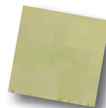
Berry Réf. 504 154