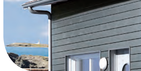
Silverwood Idéo - Gris Fossile