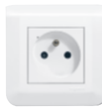
0 777 34L