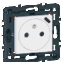
0 771 61L