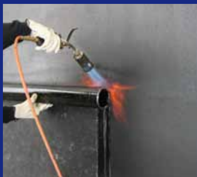
Mise en œuvre.

Toujours à l'écoute des besoins du marché, SOPREMA propose l'étanchéité des murs enterrés en toute facilité.