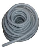
Fond de joint \varnothing 10 mm