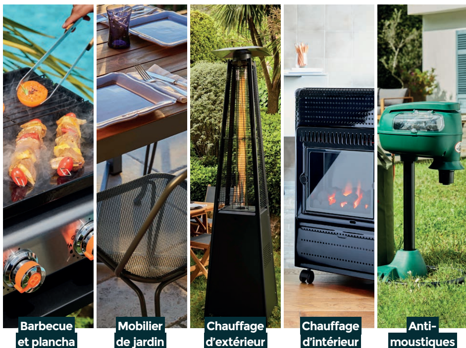
Barbecue et plancha

Véritable référence du confort et du loisir outdoor, Favex réunit tous les équipements indispensables de la maison au jardin. Du parasol chauffant à l'anti-moustiques en passant par le barbecue ou la plancha, depuis plus de 40 ans les univers Favex invitent au partage et à la détente pour transformer le quotidien.