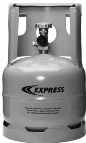
RÉF. 7796 1,6 kg propane