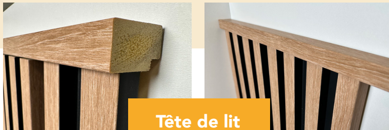
Tête de lit

En la retournant de sorte que l'épaisseur de la baguette couvre les coupes (voir photos) (Idéalement retoucher la tranche de la baguette avec une touche de peinture noire). Habiller ensuite de part et d'autre de la tête de lit d'une finition gauche et d'une finition droite.