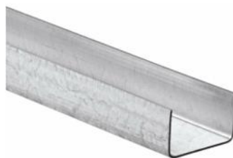
Figure 1: Visuel des profilés du groupe